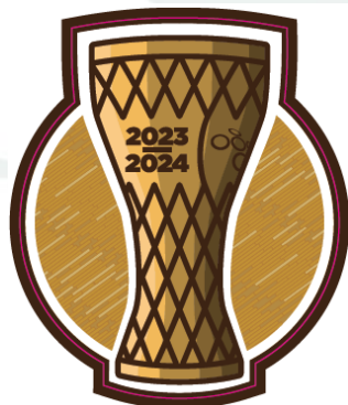
Našitek pokalnih prvakov

Zmagovalna ekipa Pokala Pivovarna Union iz pretekle sezone bo pred pričetkom posamezne sezone prejela našitke za drese, ki se nosijo na sredini na sprednji strani dresa. Našitki se lahko nosijo na vseh dresih, ki so v uporabi v posamezni tekmovalni sezoni.